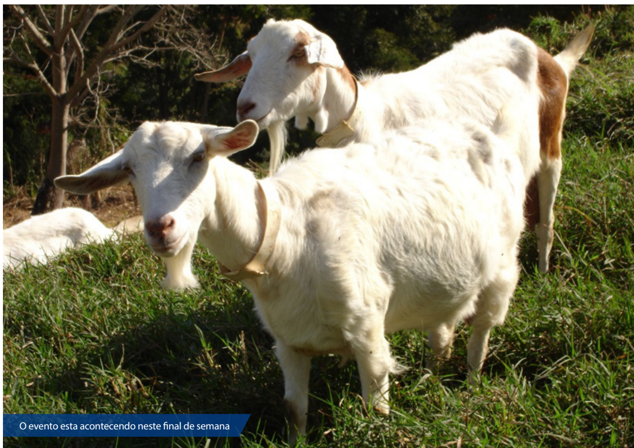
O evento esta acontecendo neste final de semana

Neste final de semana, São José de Mipibu sediará a 7ª Festa da Cabra. O evento é promovido pela Associação dos Criadores de Cabra Leiteira do Litoral Agreste Potiguar - ACLAP e acontecerá nas proximidades do pátio de entrada do próprio município. A exposição reunirá criadores de vários estados do Nordeste como Pernambuco, Ceará e Paraíba.