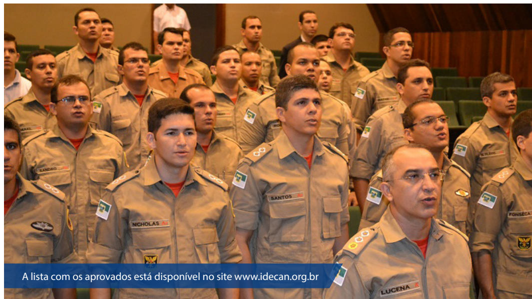
A lista com os aprovados está disponível no site www.idecan.org.br

Durante o período de formação o candidato receberá auxílio financeiro no valor de R$ 4.486,68, correspondente ao aluno do 1º ano, de R$ 5.391,50, correspondente ao aluno do 2º ano e R$ 6.161,71, correspondente ao aluno do 3º ano do Curso de Formação de Oficiais. Após o referido estágio, se considerado indicado para início na carreira de Oficial Bombeiro Militar, será nomeado ao cargo de 2º Tenente do Corpo de Bombeiros Militar do Rio Grande do Norte, com remuneração inicial no valor de R$ 7.986,00, podendo chegar a R$ 18.945,31, subsídio correspondente ao cargo de Coronel em seu maior padrão de remuneração.