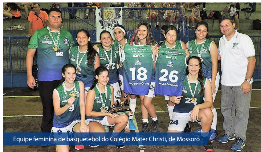
Equipe feminina de basquetebol do Colégio Mater Christi, de Mossoró

Promovido pelo Governo do Estado, por meio da Secretaria de Estado do Es-